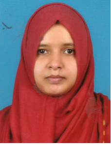
സൗദാബീവി വാർഡ് -1