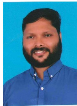
എം വി യുവേഷ്