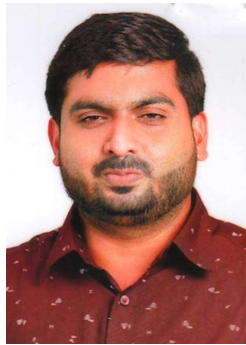
എം പി അയ്യൂബ്ഖാൻ