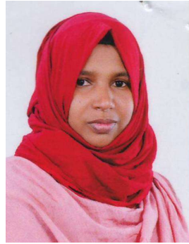
ആർഷ്യ ബി എം വാർഡ് - 17