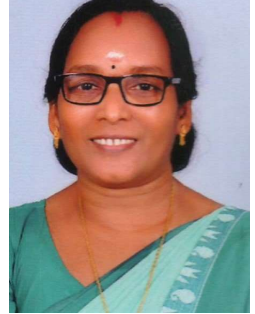
വള്ളി വി എം വാർഡ് -4